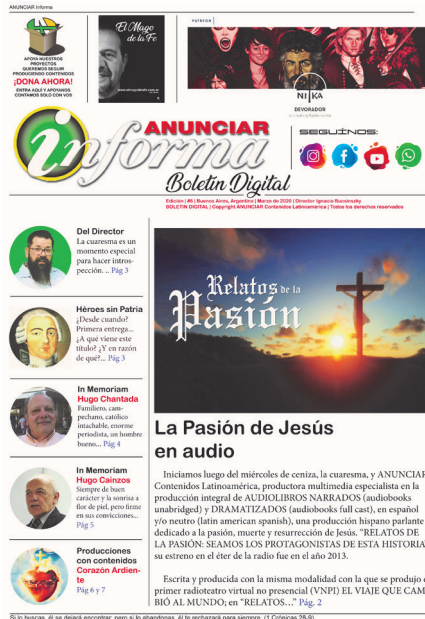
Tapa del Boletín de Marzo de 2020, promocionando el radioteatro RELATOS DE LA PASIÓN, entre otras noticias y novedades.