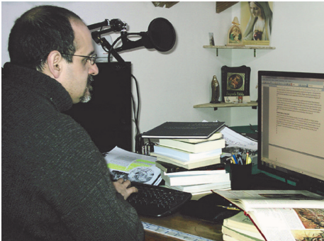
Nuestro director, guionista de esta obra cumbre, escribiendo el primer episodio, dando inicio a un proyecto que revolucionaría la radiofonía hispanoparlante.